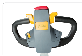
Alle Funktionen im Lenkgriff vereint.