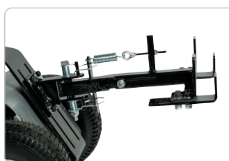
Zughaken mit vielen Einstellungen